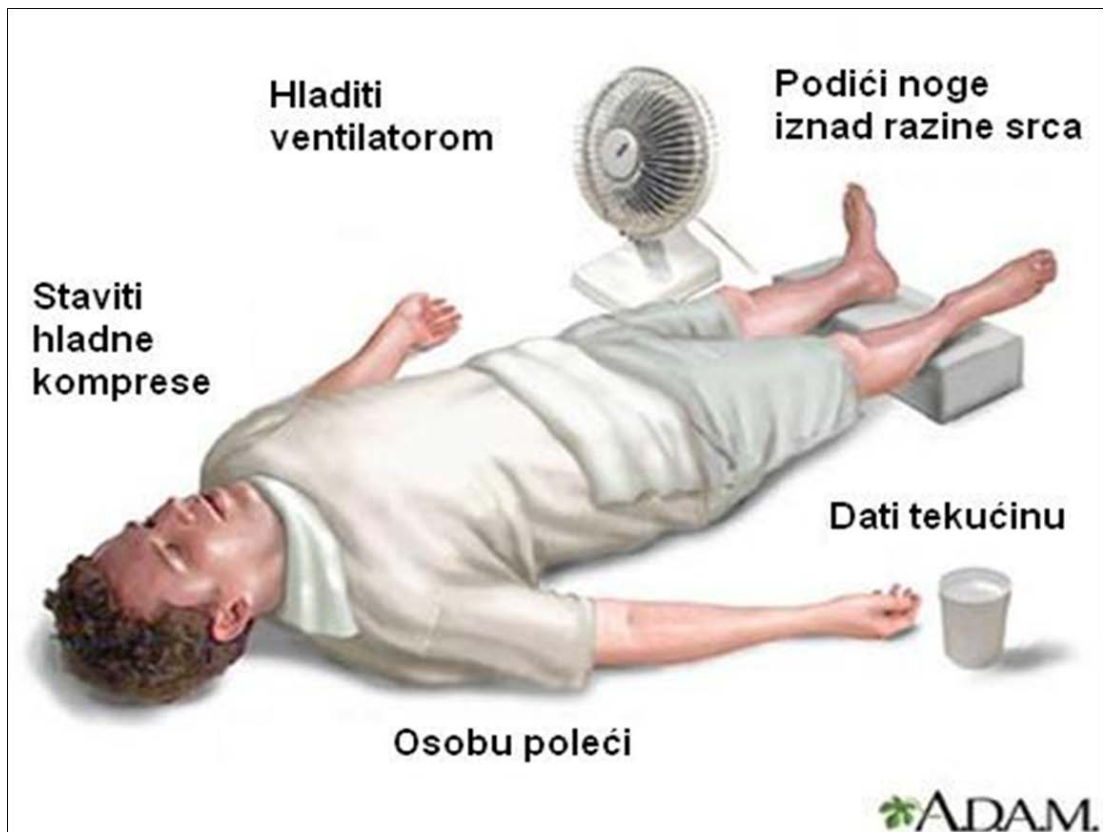
Slika 5. Prikaz pružanja prve pomoći. Rađeno prema A.D.A.M. http://www.adamimages.com/Illustration/Browse/1/H [19]

NAJVAŽNIJE OD SVEGA JE DA NIKADA NE TREBA PODCIJENITI PRVE SIMPTOME TOPLINSKOG STRESA BEZ OBZIRA NA IZMJERENE VRIJEDNOSTI INDEKSA !!!