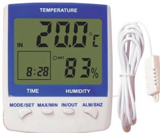
Slika 4. Termalni higrometar

Mjerenje Humideksa obavlja se pomoću mjernog uređaja, tzv. termalnog higrometra (slika 4)