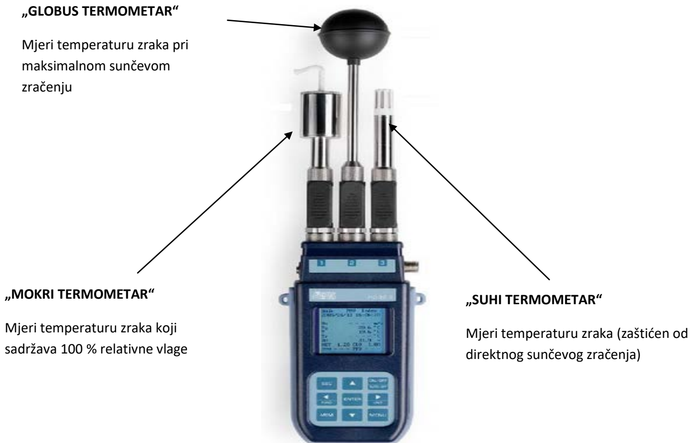
Slika 2. Uređaj za mjerenje TVT indeksa