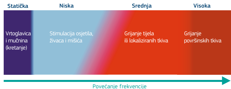
Slika 2.1. — Učinci elektromagnetskih polja u različitim rasponima frekvencije (intervali frekvencije nisu u omjeru)