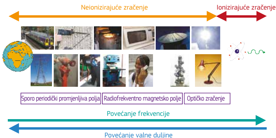
Slika 3.1. — Shematski prikaz elektromagnetskog spektra koji prikazuje neke tipične izvore

Cilj je ovog vodiča poslodavcima pružiti informacije o izvorima elektromagnetskih polja koja se nalaze u okruženju radnog mjesta kako bi im pomogle odlučiti je li potrebna daljnja procjena rizika od elektromagnetskih polja. Opseg i veličina nastalih elektromagnetskih polja ovisit će o naponima, strujama i frekvencijama na kojima oprema radi ili koje stvara, zajedno s dizajnom opreme. Neka oprema može biti dizajnirana tako da namjerno stvara vanjska elektromagnetska polja. U tom slučaju, mala niskonaponska oprema može izazvati značajna vanjska elektromagnetska polja. Općenito će za opremu koja koristi visoke struje, visoke napone ili koja je dizajnirana da emitira elektromagnetsko zračenje biti potrebna daljnja procjena.