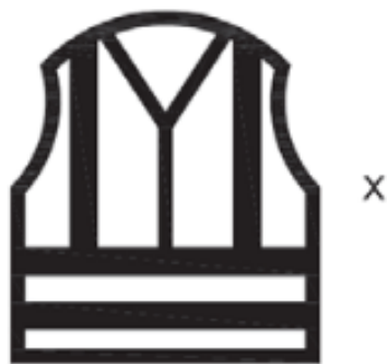
EN ISO 20471:2013